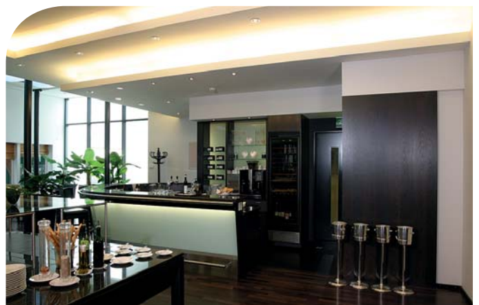
TopSolid'Wood ist die ideale Lösung für Inneneinrichter (Bild: Victoria Jungfrau Interlaken, Strasser AG Thun, Triviso AG Solothurn).