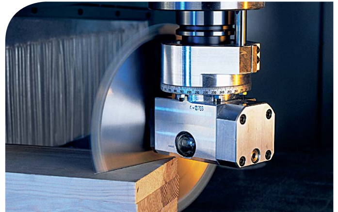
Die digitale Prozesskette zwischen CAD und CAM erlaubt eine sichere und schnelle Verbindung zwischen Projektplanung und NC-Programmierung.

Die Integration von TopSolid'Planner erfolgt zunächst im Planungsbüro durch den Aufbau einer Bibliothek mit bereits bestehenden Projekten, sowie in der Folge durch die direkt in TopSolid'Planner vorgenommenen Vorbereitungen für die Fertigung (Stücklisten, Laufkarten, Zuschnittoptimierung, Bearbeitungsprogramm usw.).