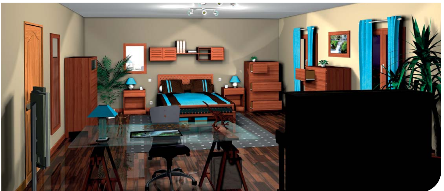
In TopSolid'Wood gestalteter Wohnraum.